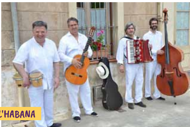
SON DE L'HABANA

Organitza: Comissió de Festes amb la col·laboració de l'Agrupació Coral i Societat del Ball