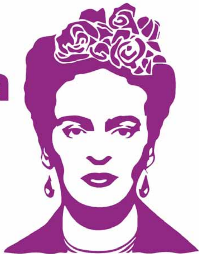
Frida Kahlo (1907-1954)

“Enamora't de tu, de la vida i després de qui tu vulguis”