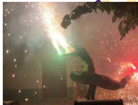
PERE LLENGUADO & CIA